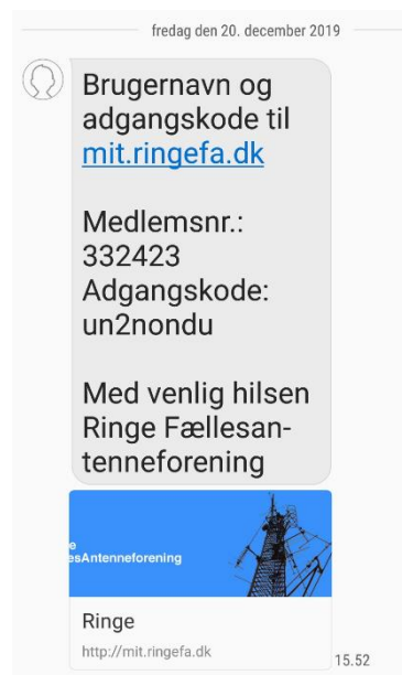
Figur 1 Eksempel på SMS

Det gør du ved at gå ind på: https://mit.ringefa.dk/ og her indtaster du det medlemsnummer og den adgangskode fra SMS'en, som vist nedenfor: